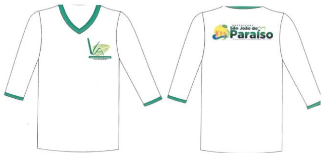
Este modelo corresponde aos itens 9, 10 e 11.