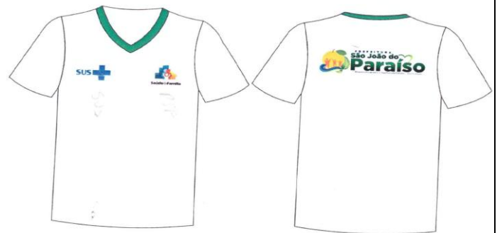
Este modelo corresponde aos itens 19, 20, 21 e 22.