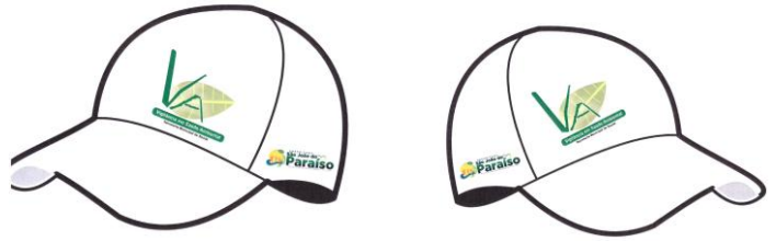
Este modelo corresponde ao item 08.