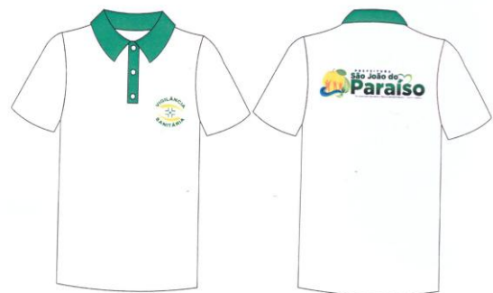
Este modelo corresponde aos itens 27 e 28