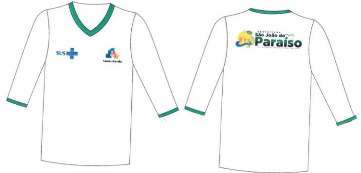
Este modelo corresponde aos itens 12, 13, 14 e 15.