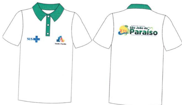
Este modelo corresponde aos itens 23, 24, 25 e 26.