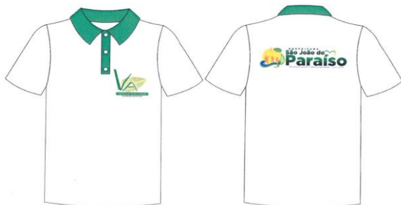
Este modelo corresponde aos itens 16, 17 e 18.