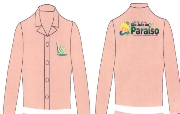
Este modelo corresponde ao item 4, 5 e 6.